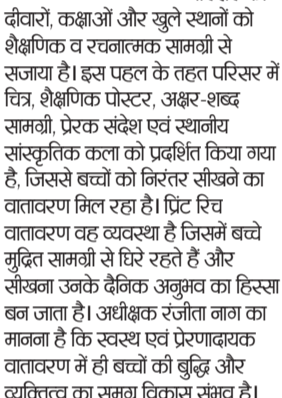
दीवारों, कक्षाओं और खुले स्थानों को शैक्षणिक व रचनात्मक सामग्री से सजाया है।