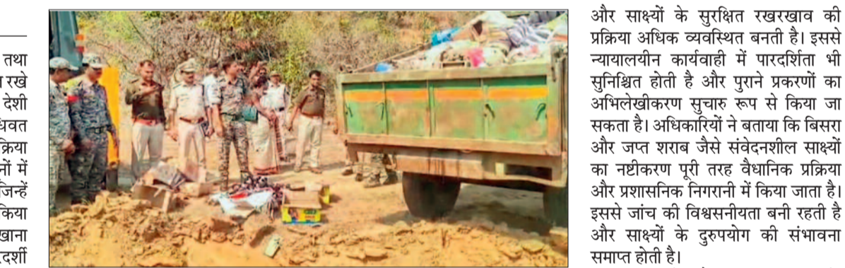
जला तै तथा न्यायिक अनुमति मिलने पर ही नष्टीकरण की प्रक्रिया अपनाई जाती है।

थाना कोरर में विभिन्न अपराध, मार्ग तथा अन्य प्रकरणों से संबंधित वर्षों से सुरक्षित रखे गए बिसरा और 500 लीटर से अधिक देशी महुआ व अंग्रेजी शराब का विधिवत नष्टीकरण किया गया। न्यायालयीन प्रक्रिया पूर्ण होने के बाद सुरक्षित रखे गए नमूनों में कुछ बिसरा 20 वर्ष से अधिक पुराने थे, जिन्हें निधारित वैधानिक प्रक्रिया के तहत नष्ट किया गया। पुलिस की इस कार्रवाई को मालखाना प्रबंधन, साक्ष्य संरक्षण और पारदर्शी प्रशासनिक व्यवस्था की दिशा में महत्वपूर्ण कदम माना जा रहा है।